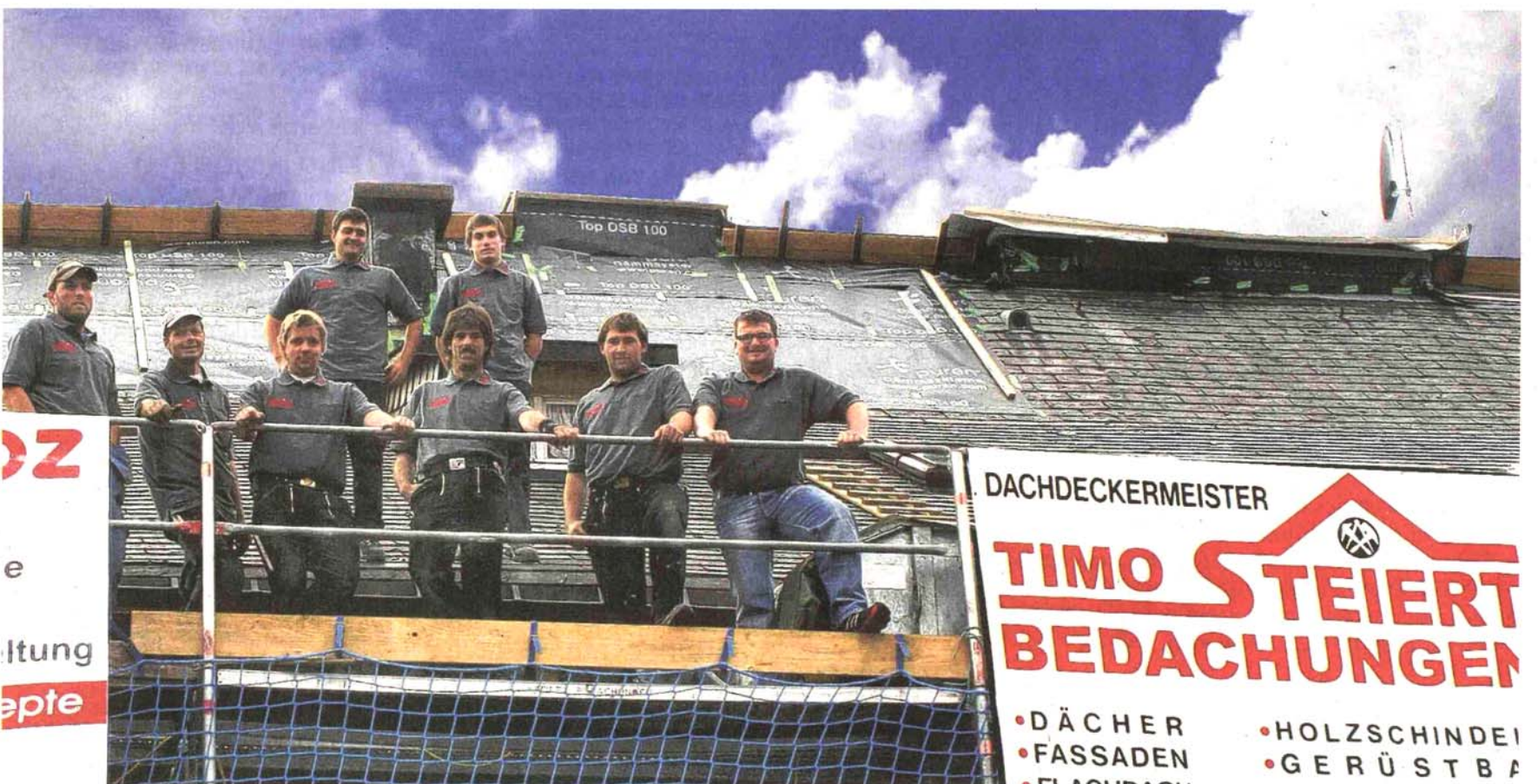
Über den Dächern von Schluchsee ist die Belegschaft der Firma Steiert stets schwindelfrei.

milie oder gar der Lottofee. Die anschließende Expansion forderte bald Tribut und so wurde folgerichtig im Jahr 2002 die Firmenhalle im Industriegebiet in Schluchsee gebaut.